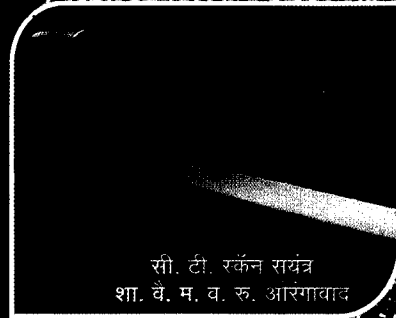
सी. टी. रफ्तन सयंत्र शा. वै. म. व. रु. आरगावाव