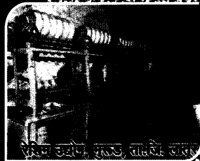
रेडिअर उद्योग, सुळड, ता.पि. लखर